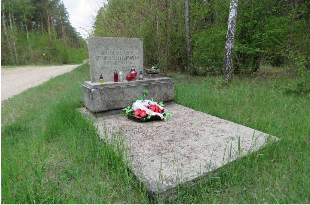
Symboliczny nagrobek w miejscu mogiły ludności żydowskiej pod Tarnowem.