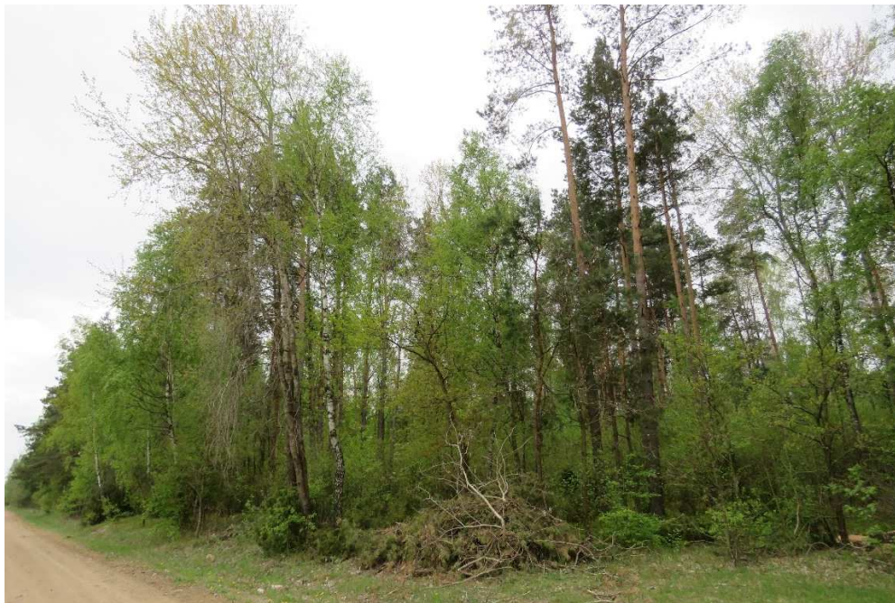
Lokalizacja dawnego cmentarza wojennego w Zaruziu.