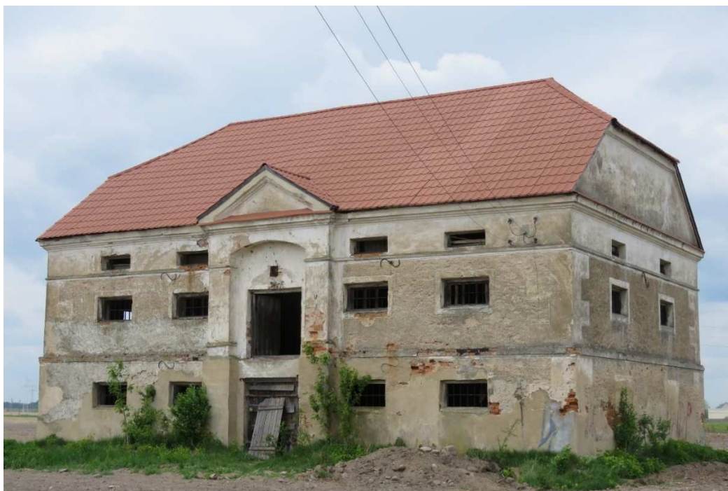
Spichlerz w zespole dworsko-folwarcznym w Drogoszewie.

Spichlerz murowany z cegły, na kamiennych fundamentach, tynkowany. Rozmieszczony na planie prostokąta, trójkondygnacyjny. Elewacja frontowa pięcioosiowa, w środkowej osi ryzalit z arkadą, nad nim trójkątny tympanon; gzymsy profilowane, kordonowe i koronujące; boniowane naroża. Elewacja północna, wzdłużna, pięcioosiowa, prosta; elewacje rozdzielone gzymsem kordonowym; boniowane narożniki. Elewacje szczytowe analogiczne, dwuosiowe, w parterze otwory okienne ślepe, wyżej okienne. Dach naczółkowy.