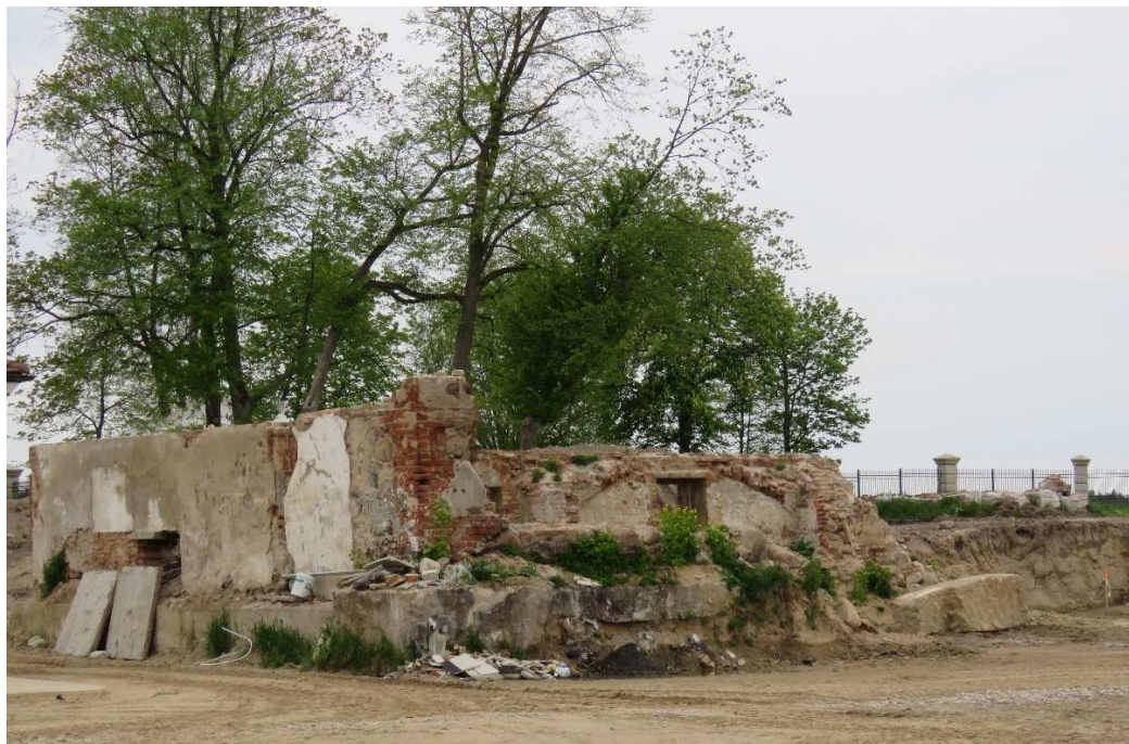
Ruiny spichlerza dworskiego w Tarnowie.