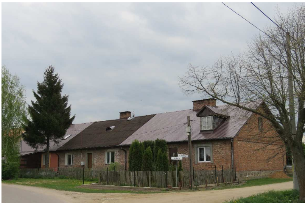
Sześciorak w zespole dworsko-folwarcznym w Tarnowie.

Elewacje szczytowe ślepe. Dach dwuspadowy, wtórnie pokryty blachą. Każdy z segmentów odznacza się odmienną stylistyką elewacji i pokrycia dachu.