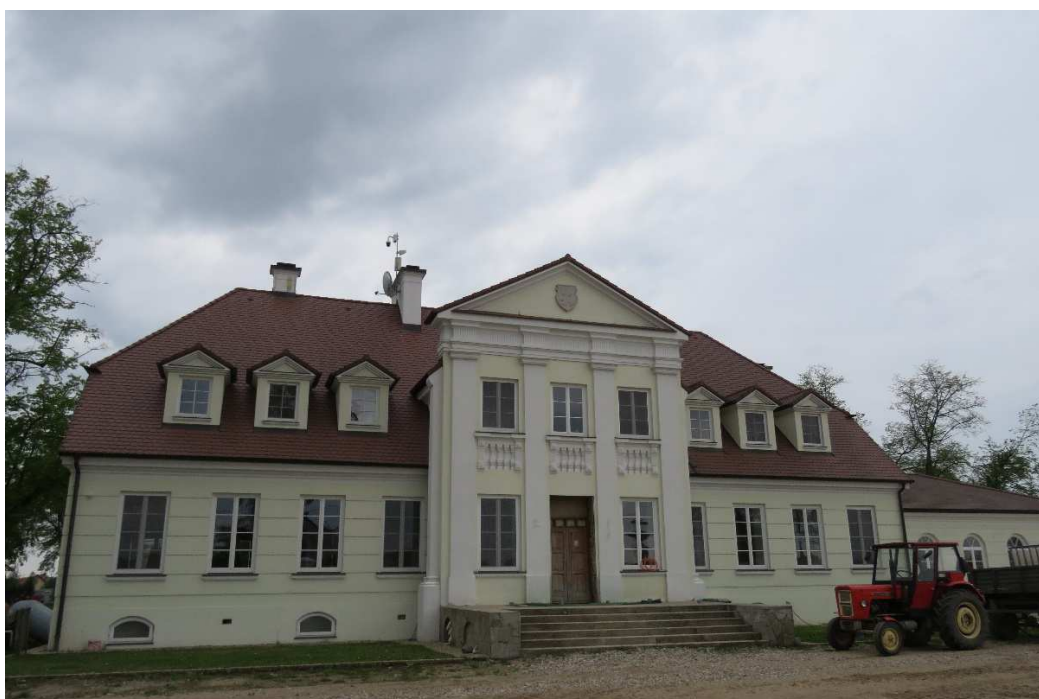
Dwór w Tarnowie.

W roku 1950 przeprowadzono gruntowny remont budynku dostosowując go do siedziby szkoły podstawowej. Obecnie dwór stanowi własność prywatną. Nowy właściciel przywraca obiektowi dawny, oryginalny wygląd.