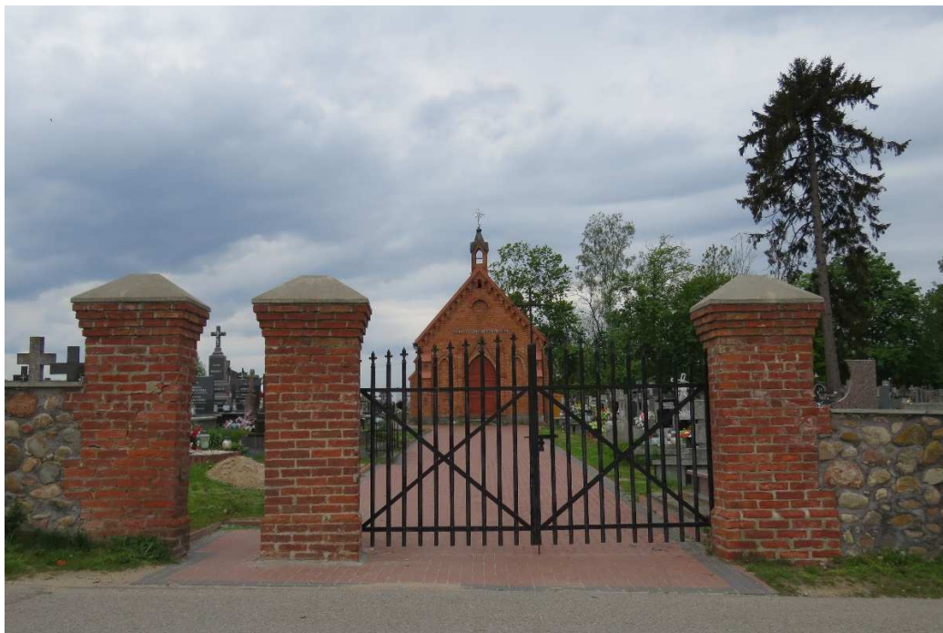
Cmentarz parafialny w Miastkowie.

Cmentarz rozmieszczony na planie wydłużonego prostokąta, z regularnym układem alei. Główna aleja poprzeczna biegnie od wejścia do kaplicy grobowej wzniesionej w centralnej części nekropoli. Od niej, na północ i południe odchodzą po trzy aleje wzdłużne (w części południowej aleja zachodnia została zatarta).