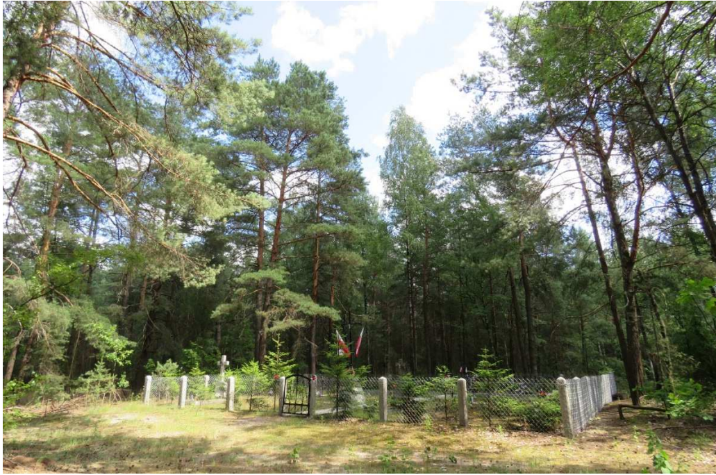
Cmentarz wojenny z 1920 r. w Czartorii.