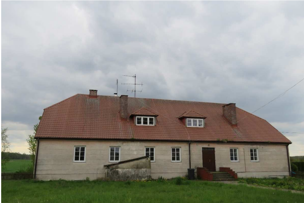
Oficyna dworska w Tarnowie.