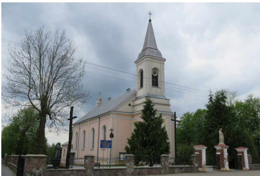
Kościół parafialny w Miastkowie.

Kościół stanowi cenny przykład architektury sakralnej regionu, stanowiąc manifest religijnej tożsamości mieszkańców.