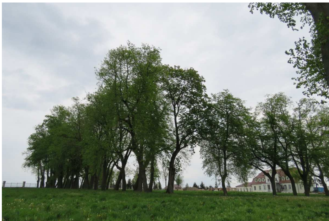
Park dworski w Tarnowie.