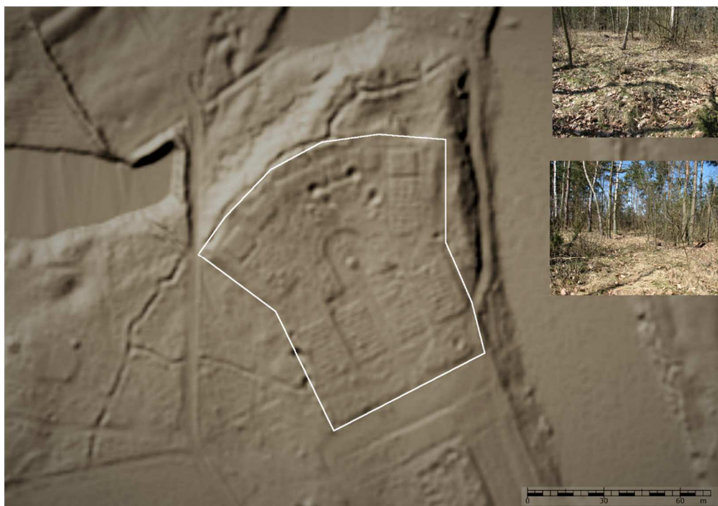
Numeryczny model terenu cmentarza wojennego w Nowosiedlinach. Portal mapowy NID

Pierwotnie kopiec stanowił podstawę drewnianego krzyża o wysokości 5 m.