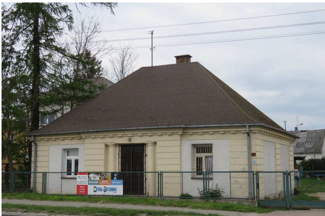
Dom dróżnika w Miastkowie.