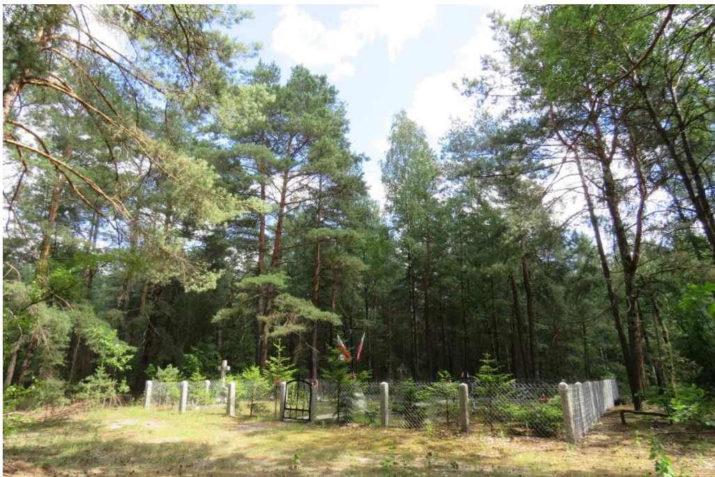
Cmentarz wojenny z 1920 r. w Czartorii.