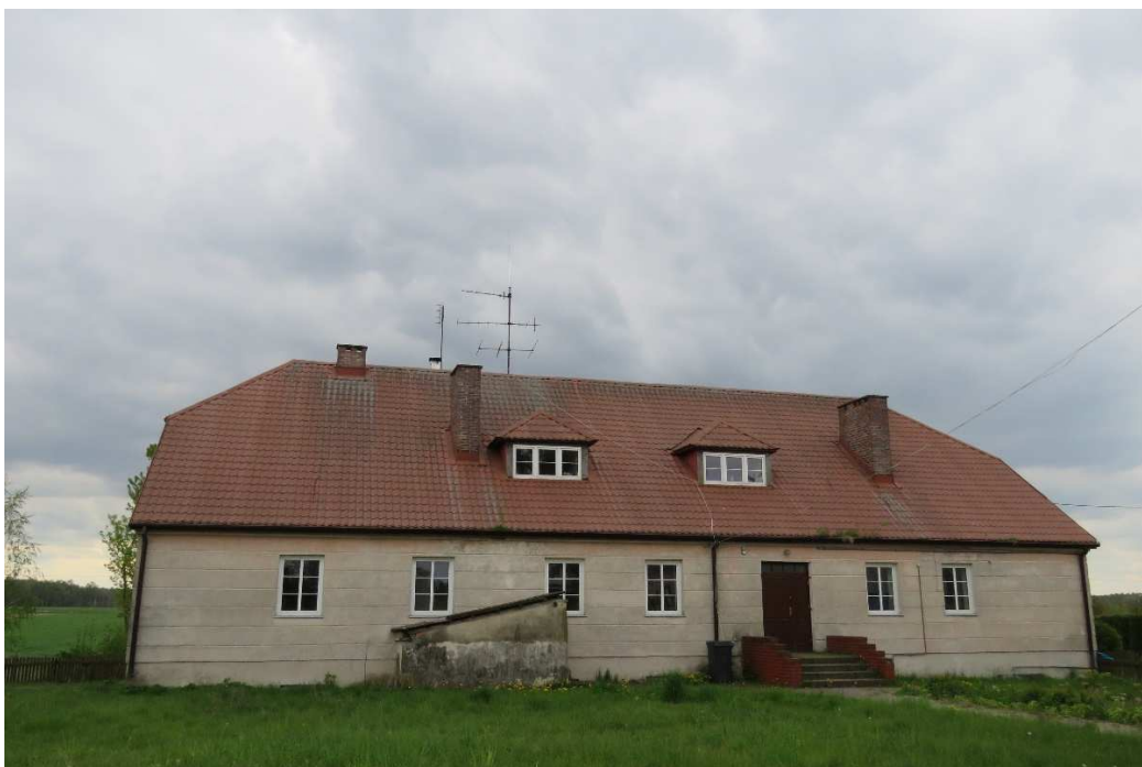
Oficyna dworska w Tarnowie.