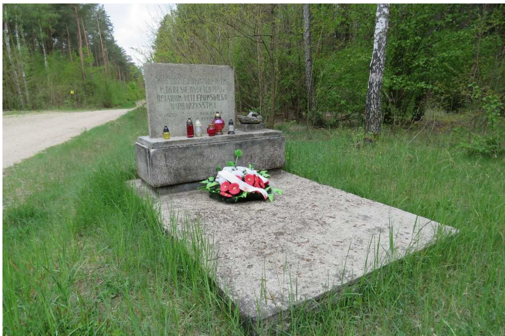
Symboliczny nagrobek w miejscu mogiły ludności żydowskiej pod Tarnobrzegiem.

Nagrobek wzniesiony został w 1971 r. Stanowi typowy przykład wytwórczości sepulkralnej tamtego okresu. Jest to mogiła symboliczna, nie wyznaczająca zasięgu rzeczywistego cmentarza.